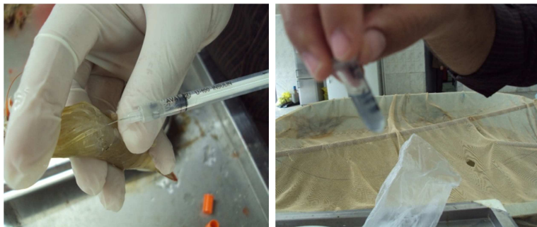
شکل 1: نحوه برداشت همولنف از سینوس شکمی میگوی وانامی

سرنگ انسولین با سر و سوزن شماره 26 از طریق سینوس شکمی انجام شد (شکل 1).