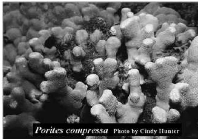
شکل ۱: آبسنگ مرجانی Porites compressa

با توجه به نتایج بدست آمده در این تحقیق و مقایسه ی آن با کارهای انجام شده، عوامل مهمی در نابودی این اکوسیستم های با ارزش نقش دارند که از مهمترین این عوامل آلودگی نفتی و کدورت می باشد و از آنجاییکه آبسنگ های مرجانی پناهگاه طیف عظیمی از ارگانیسم های دریایی می باشند لذا حفاظت از این اکوسیستم ها بسیار حائز اهمیت است. و یکی از شاخص های مهمی که در حفظ حیات مرجان ها دخیل می باشد، زئوگزان‌تلا می باشد، بنابراین بررسی و مطالعه ی این ارگانیسم های همزیست به حفظ بقای این موجودات کمک شایانی می کند.