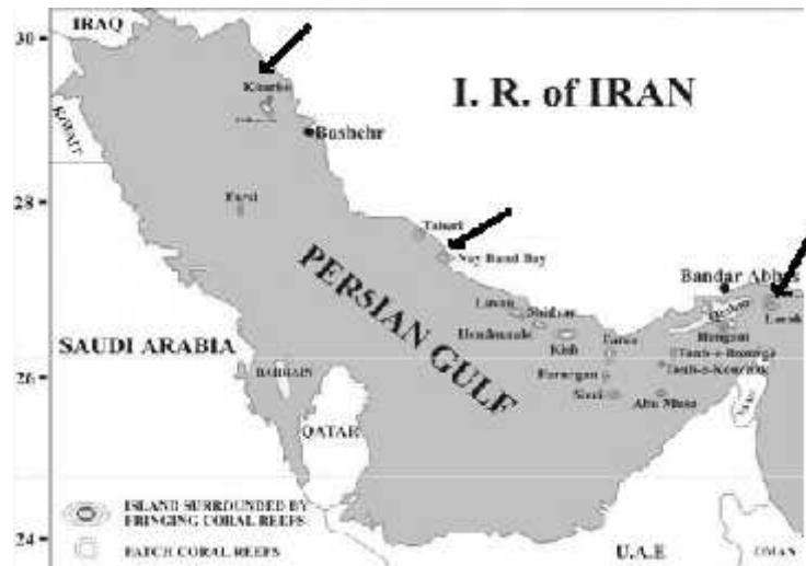
شکل ۲: پراکنش آبسنگ‌های مرجانی در شمال خلیج فارس، آب‌های ایران (Fatemi and Shokri, 2001)