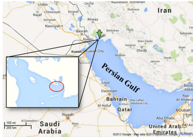
شکل ۱: منطقه نمونه‌برداری از گربه کوسه لکه‌دار در آب‌های خلیج فارس (بیضی قرمز رنگ).

Duncan استفاده شد. اختلاف در سطح اطمینان بالای ۹۵٪ ( P < 0.05 ) بررسی شد. رسم نمودارها در محیط برنامه Microsoft Office Excell 2010 با استفاده از داده‌های مستخرج از برنامه SPSS رسم شد (Movahedinia et al., 2009).